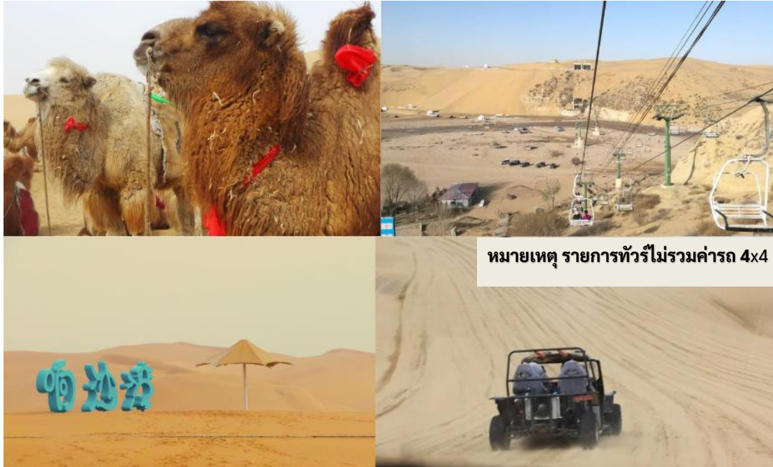
หมายเหตุ รายการทัวร์ไม่รวมค่ารถ 4x4

กลางวัน รับประทานอาหารกลางวัน ณ ภัตตาคาร (มื้อที่ 8)